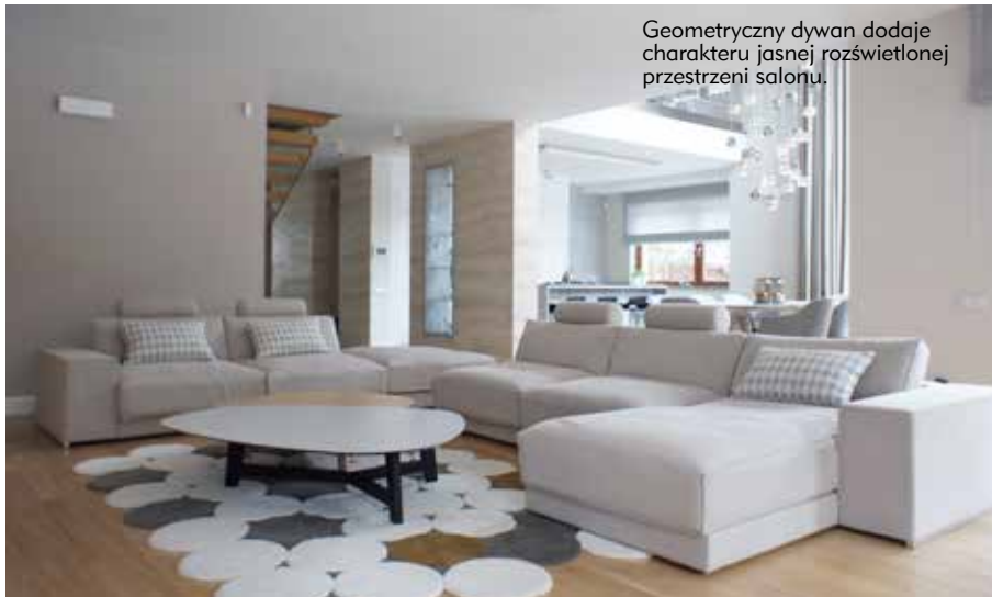
Geometryczny dywan dodaje charakteru jasnej rozświetlonej przestrzeni salonu.