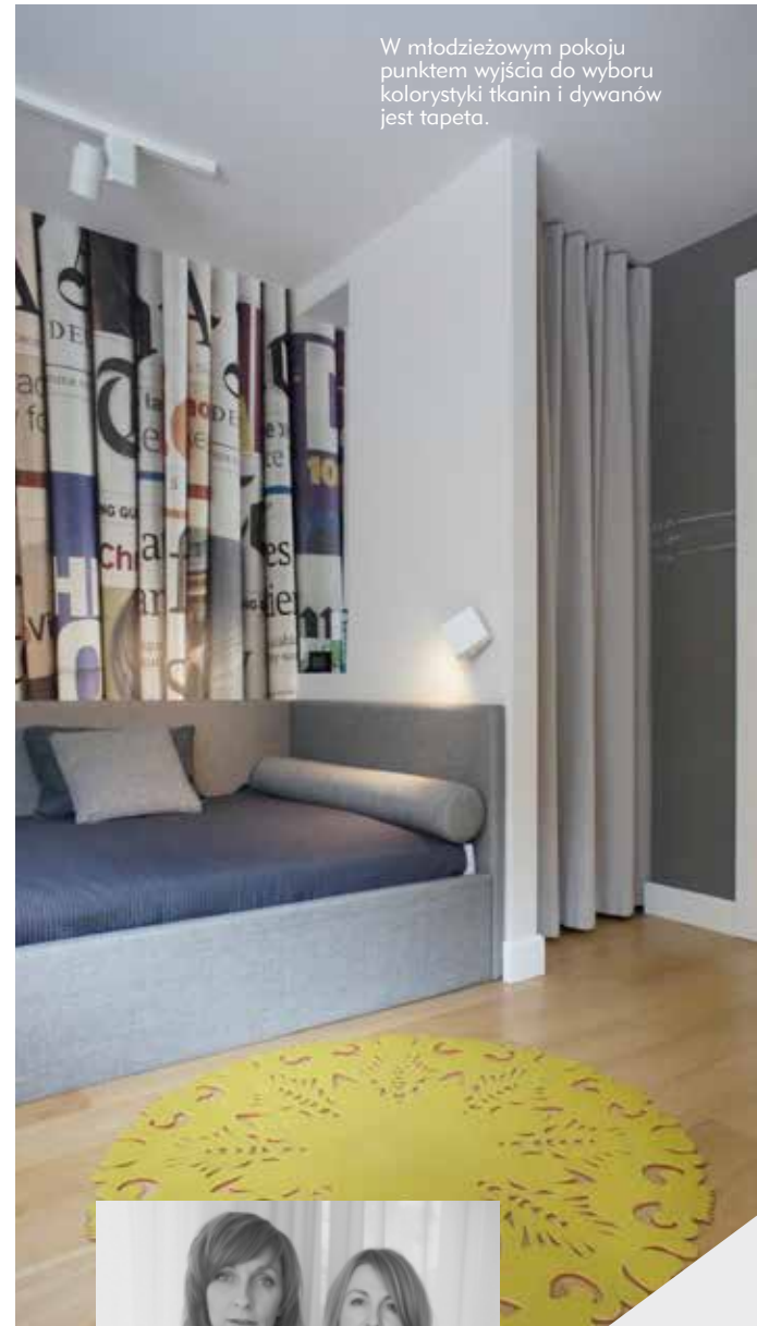
W młodzieżowym pokoju punktem wyjścia do wyboru kolorystyki tkanin i dywanów jest tapeta.