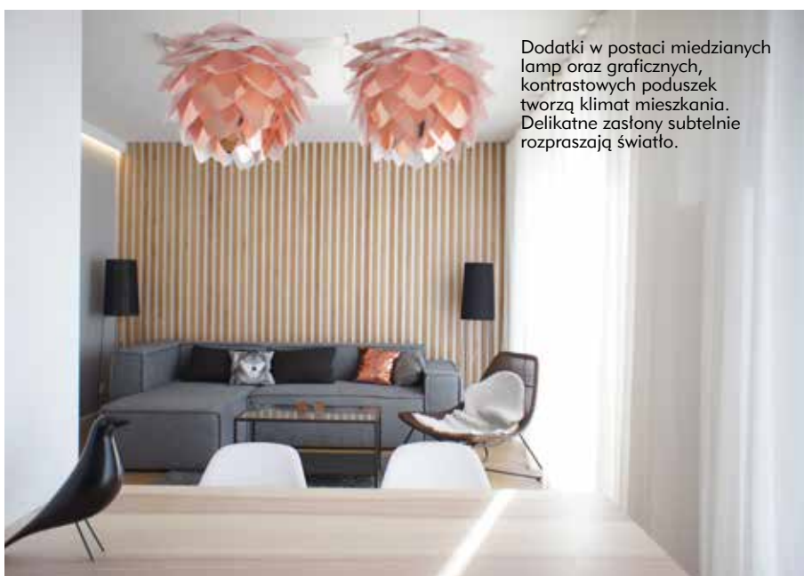
Dodatki w postaci miedzianych lamp oraz graficznych, kontrastowych poduszek tworzą klimat mieszkania. Delikatne zasłony subtelnie rozpraszają światło.