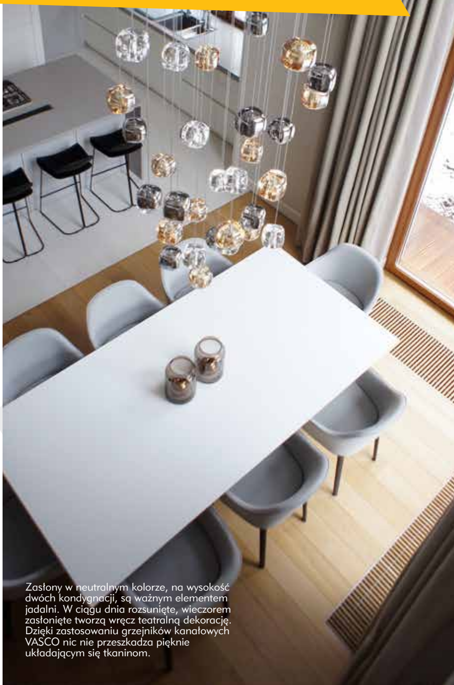
Zasłony w neutralnym kolorze, na wysokość dwóch kondygnacji, są ważnym elementem jadalni. W ciągu dnia rozsunięte, wieczorem zasłonięte tworzą wręcz teatralną dekorację. Dzięki zastosowaniu grzejników kanałowych VASCO nic nie przeszkadza pięknie układającym się tkaninom.

Mistrzami w wykorzystywaniu tkanin są Skandynawowie, ale i Brytyjczycy, Belgowie czy Holendrzy. Często podróżując zachwycamy się ich naturalną umiejętnością zestawiania tkanin, chętnie się nimi inspirujemy. Pamiętajmy jednak jak wiele wspaniałych wzorów wymyślili polscy projektanci, czekamy, aby odkryć je na nowo.